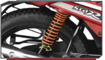
5 ಹಂತಗಳ ಹೊಂದಾಣಿಕೆಯ ಹೈಡ್ರಾಲಿಕ್ ಶಾಕ್ ಅಬ್ಸಾರ್ಬರ್