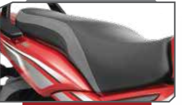
ಪ್ರಿಮಿಯಮ್ ಡ್ಯೂಲ್ ಟೋನ್ ಸೀಟ್