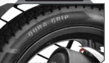
ಡ್ಯೂರಾ ಗ್ರಿಪ್ ಟಯರ್