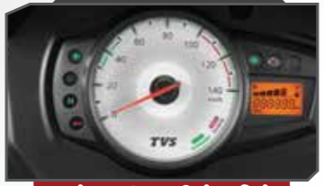
ಎಕೊನಾಮೀಟರಿನೊಂದಿಗೆ ಮಲ್ಟಿ-ಫಂಕ್ಷನ್ ಕನ್ನೋಲ್