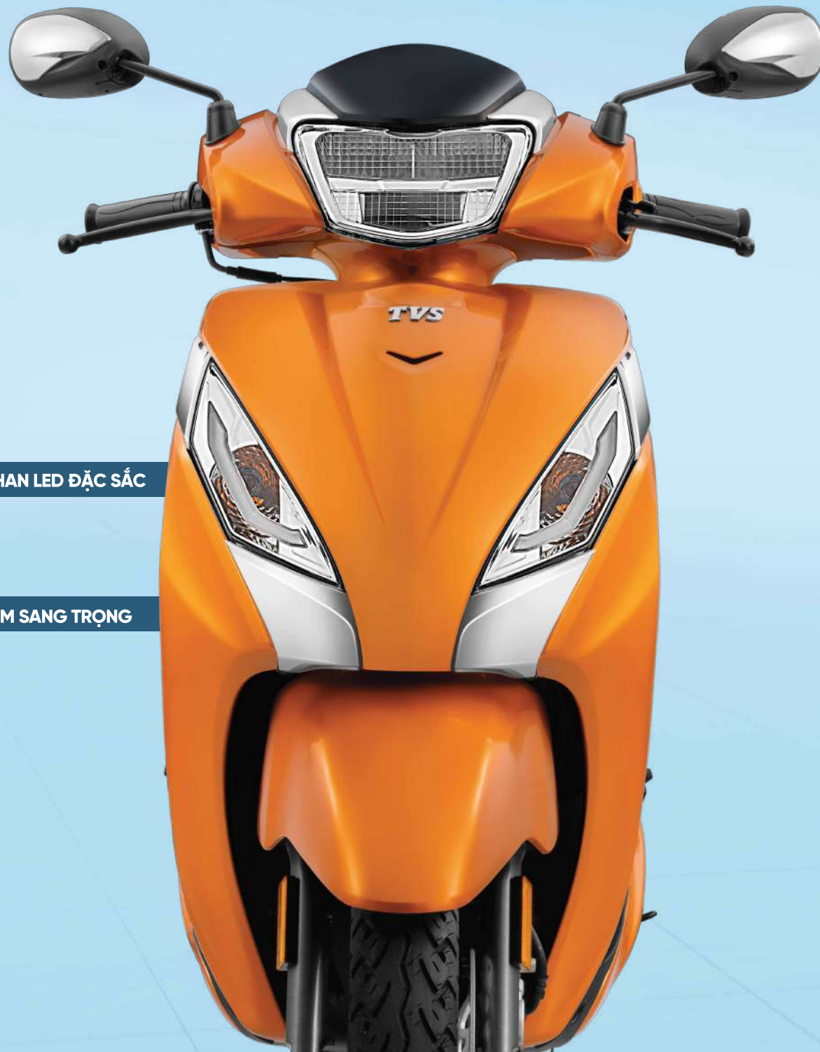
ĐÈN XI NHAN LED ĐẶC SẮC