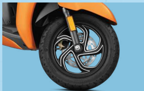
MÂM HỢP KIM DIAMOND-CUT