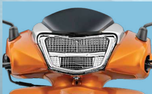
ĐÈN PHA LED PHONG CÁCH