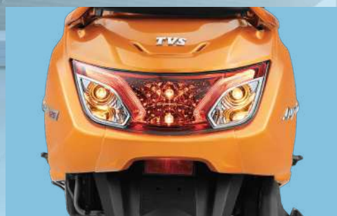
ĐÈN HẬU THANH LỊCH